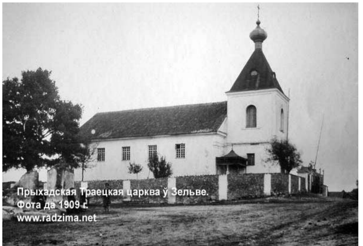
Приходская Троицкая церковь в Зельве. Фото да 1909 г.

Одновременно велись работы и на крыше храма. Шифер заменили на металлочерепицу, затем в виде арок, соединенных между собой, достроили колокольню, шатер, установили купол с крестом. Немного позже небольшой купол,