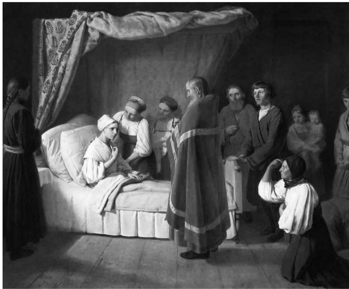
Венецианов А.Г. Причащение умирающей

любящего Бога, Который принимает всех. Особенно если священник умеет сопереживать. Сопереживание ведь не требует каких-то особых знаний, можно просто помолчать и внимательно послушать, что человек говорит, не перебивать его, не демонстрировать, что у тебя нет времени. Показать, что он для тебя важен сейчас, и он может сказать всё, что посчитает нужным. Когда есть сопереживание, есть и примирение с собой, а значит, смерть становится достаточно лёгкой.