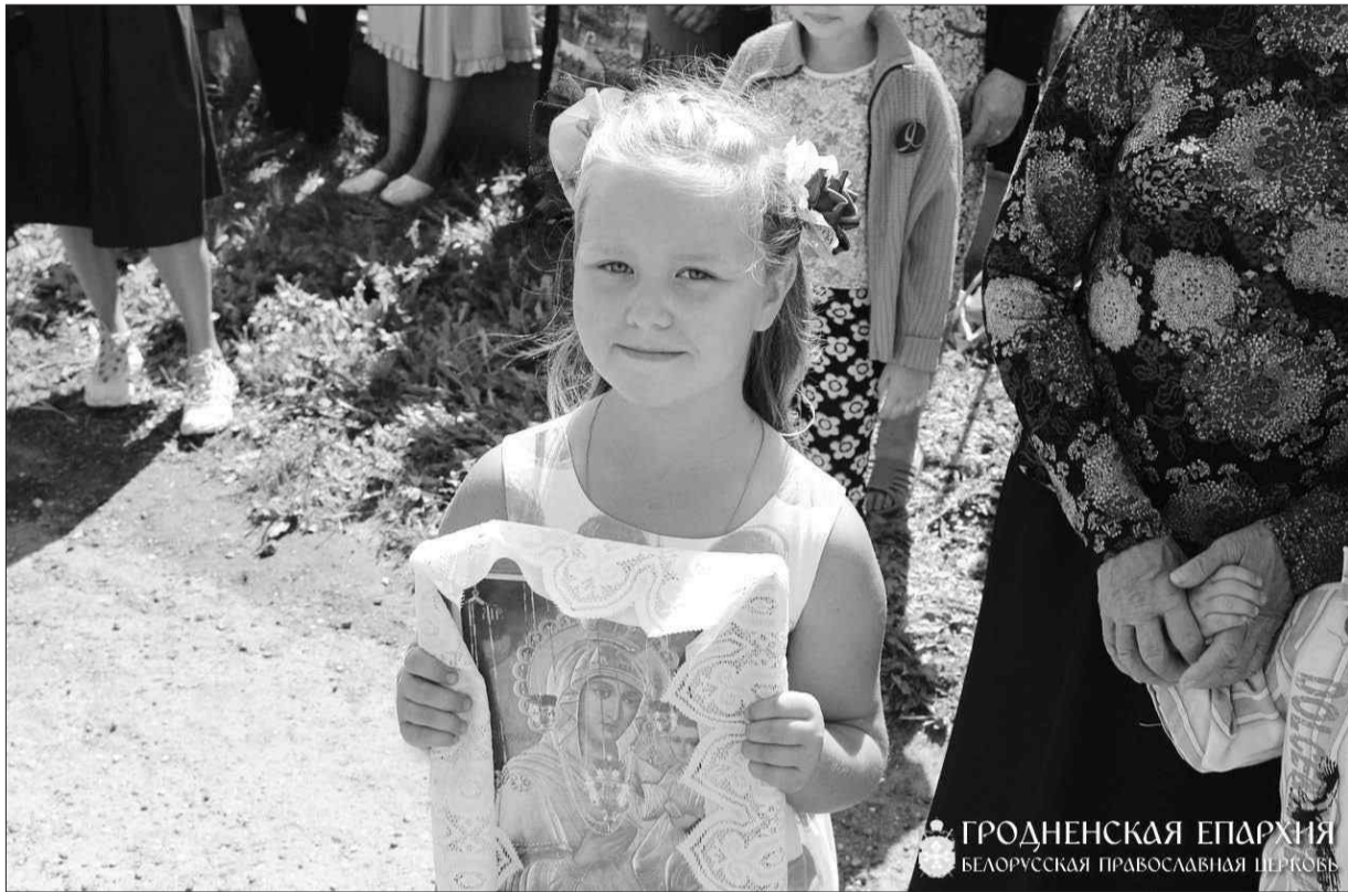
ГРОДНЕНСКАЯ ЕПАРХІЯ БЕЛОРУССКАЯ ПРАВОСЛАВНАЯ ЦЕРКВА

Сёння, 10 жніўня паводле новага стылю, або 28 ліпеня паводле старога стылю, ушаноўваецца Маці Божая дзеля іконы Яе Ракавіцкай. Паводле вуснага падання, святы абраз быў яўлены пану Макрэцкаму, на сродкі якога быў збудаваны храм недалёка ад месца адшукання іконы.