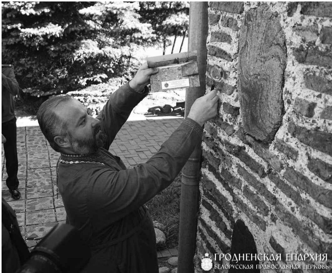
ГРОДНЕНСКАЯ ЕПАРХИЯ БЕЛОРУССКАЯ ПРАВОСЛАВНАЯ ЦЕРКОВЬ