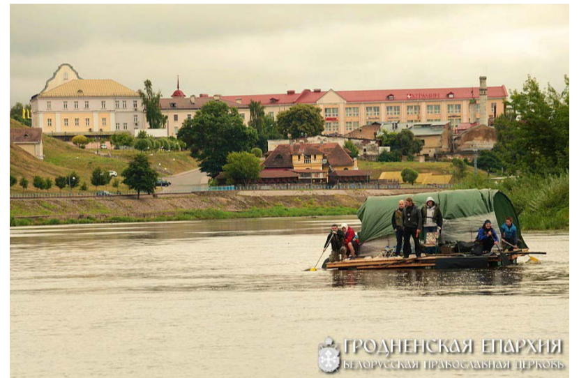
ГРОДНЕНСКАЯ ЕПАРХИЯ БЕЛОРУССКАЯ ПРАВОСЛАВНАЯ ЦЕРКОВЬ