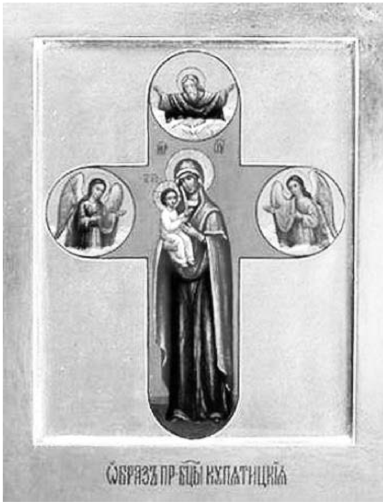
Икона Божией Матери "Купятицкая"