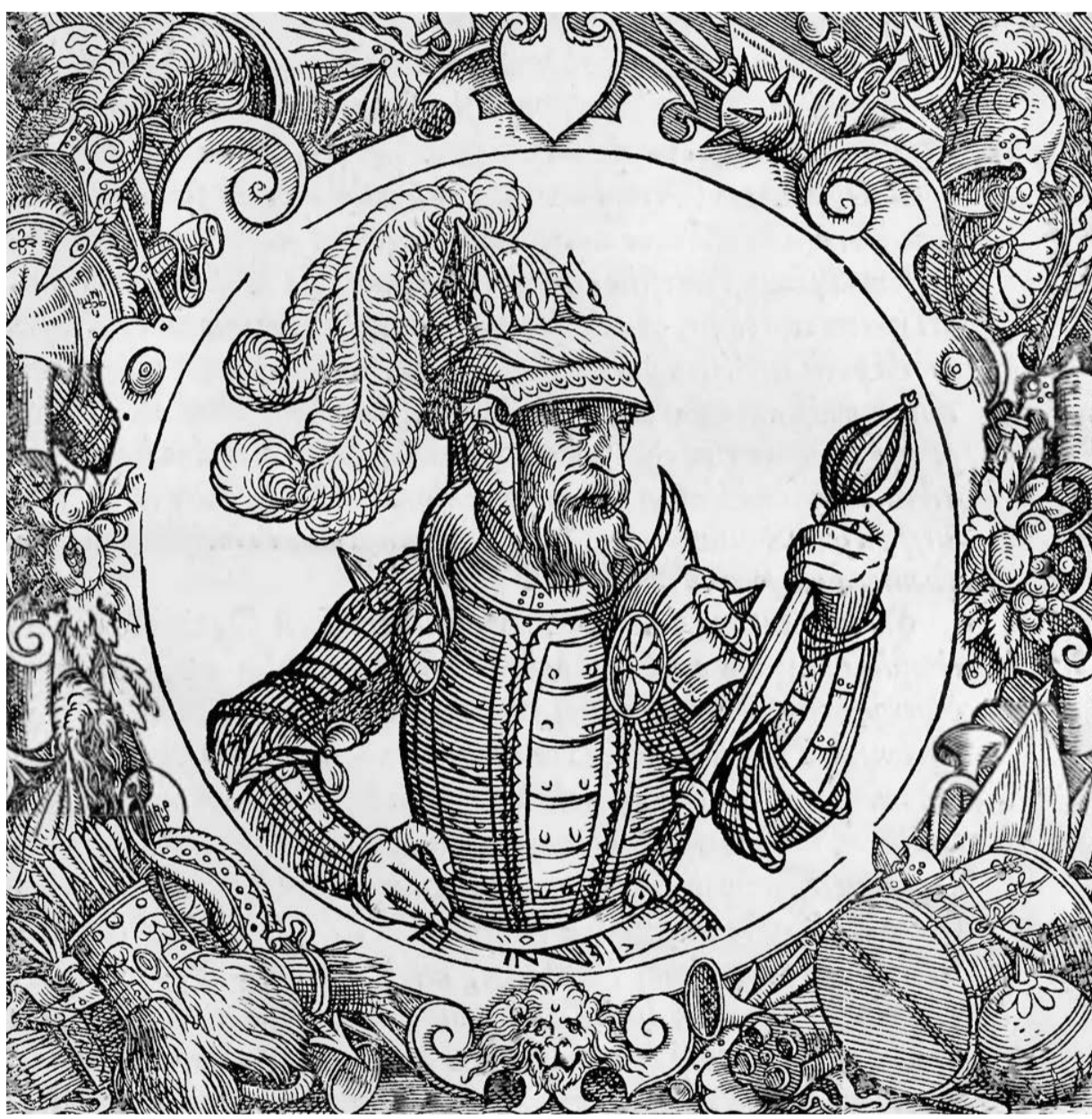
великий князь Литовский Ольгерд (Гравюра из «Описания Европейской Сарматии», 1578)

Мученики Антоний, Иоанн и Евстафий входят в Собор Белорусских святых.