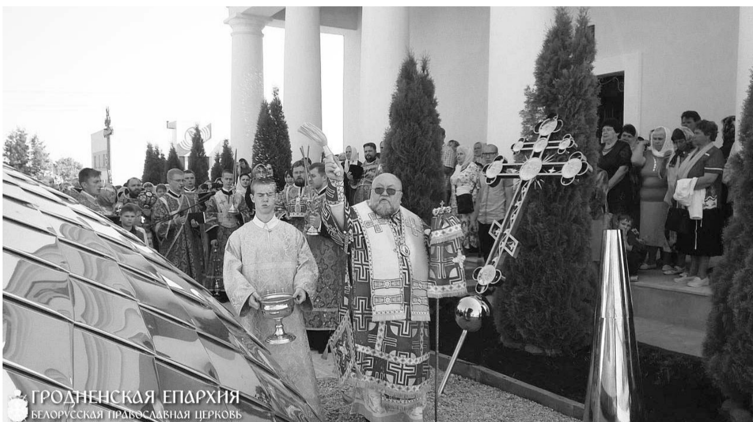
ГРОДНЕНСКАЯ ЕПАРХИЯ БЕЛОРУССКАЯ ПРАВОСЛАВНАЯ ЦЕРКОВЬ