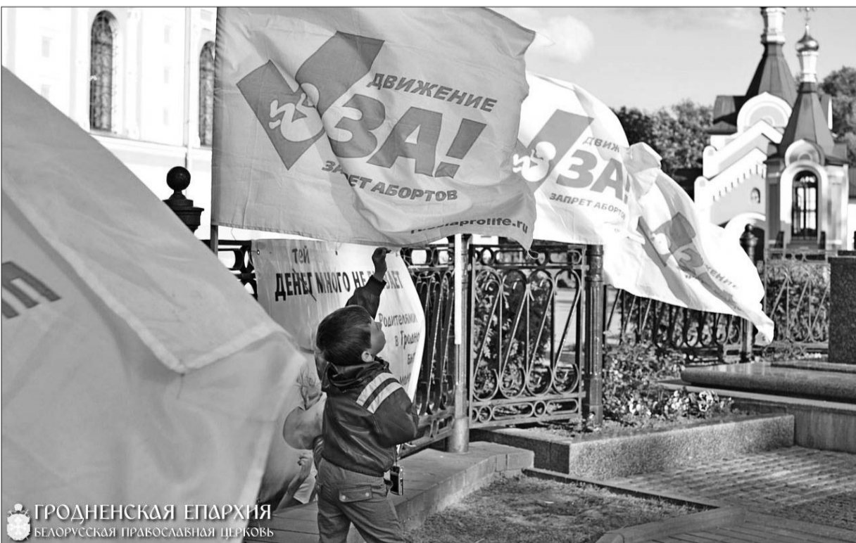
ГРОДНЕНСКАЯ ЕПАРХИЯ БЕЛОРУССКАЯ ПРАВОСЛАВНАЯ ЦЕРКОВЬ

15 дней, до 1 июня, Международного дня защиты детей, мы выходим на улицы с призывами: «Мамочка, мое сердце уже бьется! Не останавливай его!», «Мамочка, моя жизнь в твоих руках! Сохрани мне жизнь!».