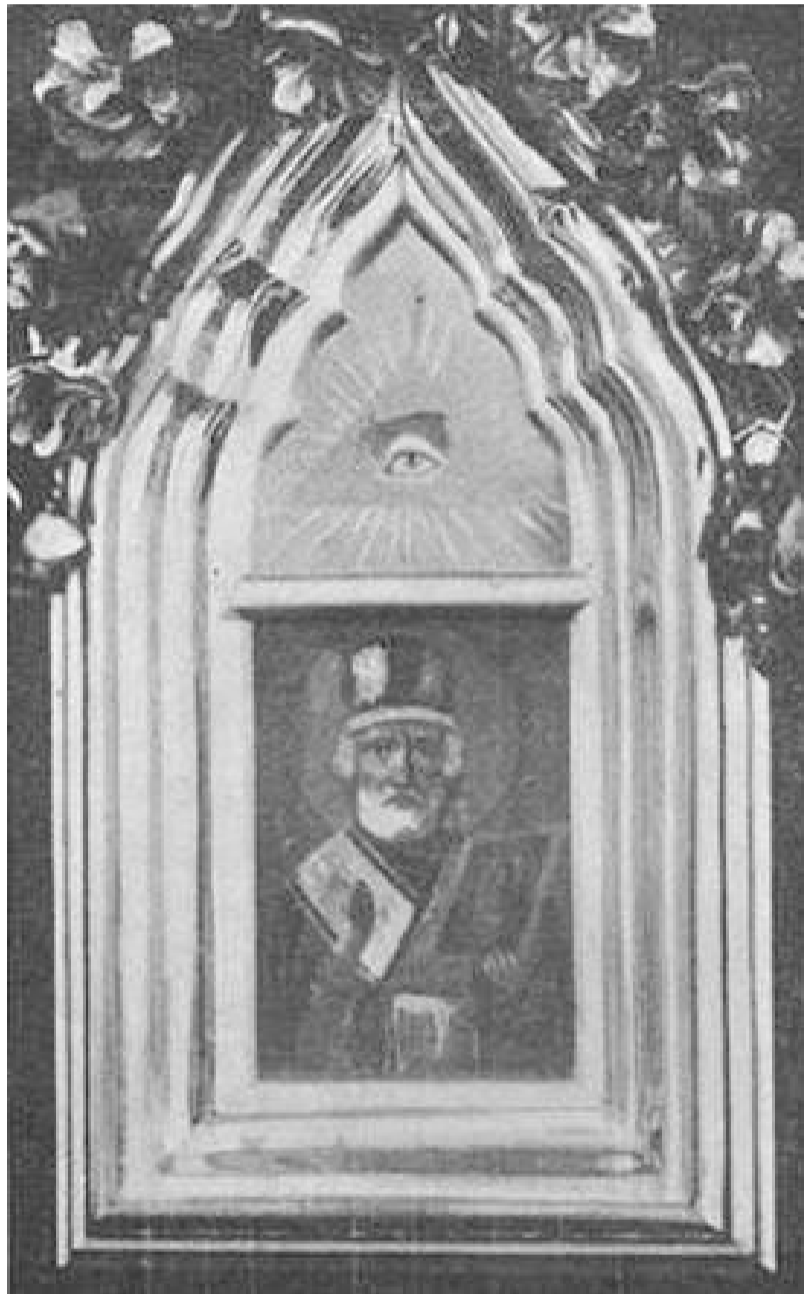
Дошедшее до наших дней изображение чудотворной иконы святителя Николая

Гродненский кафедральный Свято-Покровский собор. К сожалению, описанную в старинном документе икону там обнаружить не удалось, ничего не смогли рассказать о ней и служители храма.