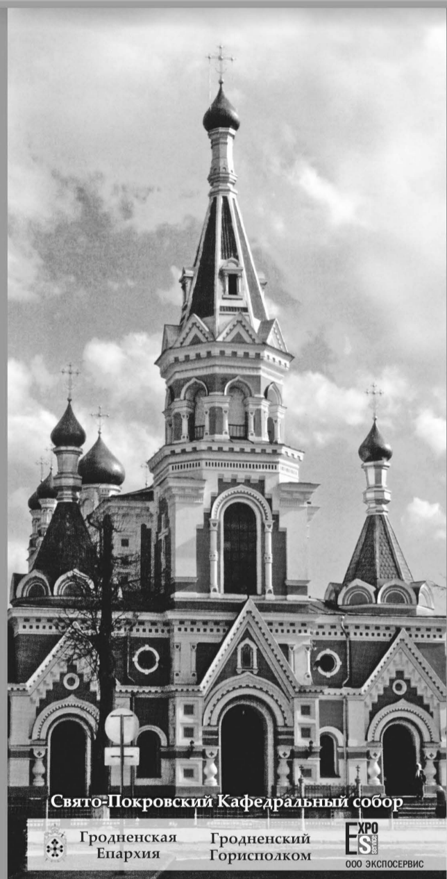
Свято-Покровский Кафедральный собор

16-23 мая с 11.00 до 20.00 ДК пл. Советская, 6 23 мая с 11.00 до 15.00