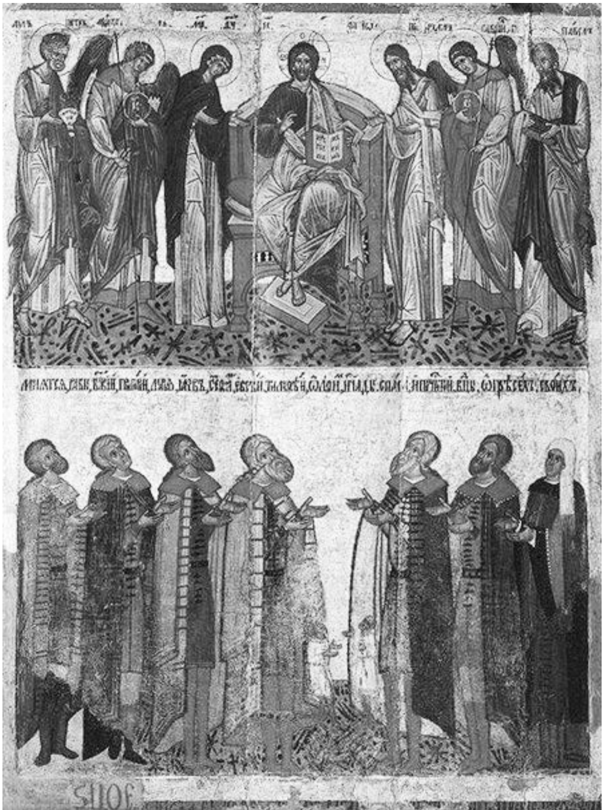
Деисус и молящиеся новгородцы. Вторая половина XV в. Новгородский государственный объединенный музей-заповедник