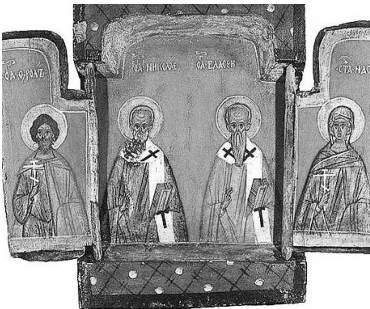
Складень с избранными святыми. XIV в. Новгород. Государственная Третьяковская галерея

Также «семейной иконой» может быть «частник» (другими словами «складень»), то есть икона, состоящая из нескольких икон (частей), соединённых в общую композицию. На одной из частей такой иконы изображают святых покровителей, или же их изображают в клеймах на полях. Также на такой иконе может быть написан «Деисус» (изображение в центре Христа с предстоящими по бокам Богоматерью и Иоанном Кре-