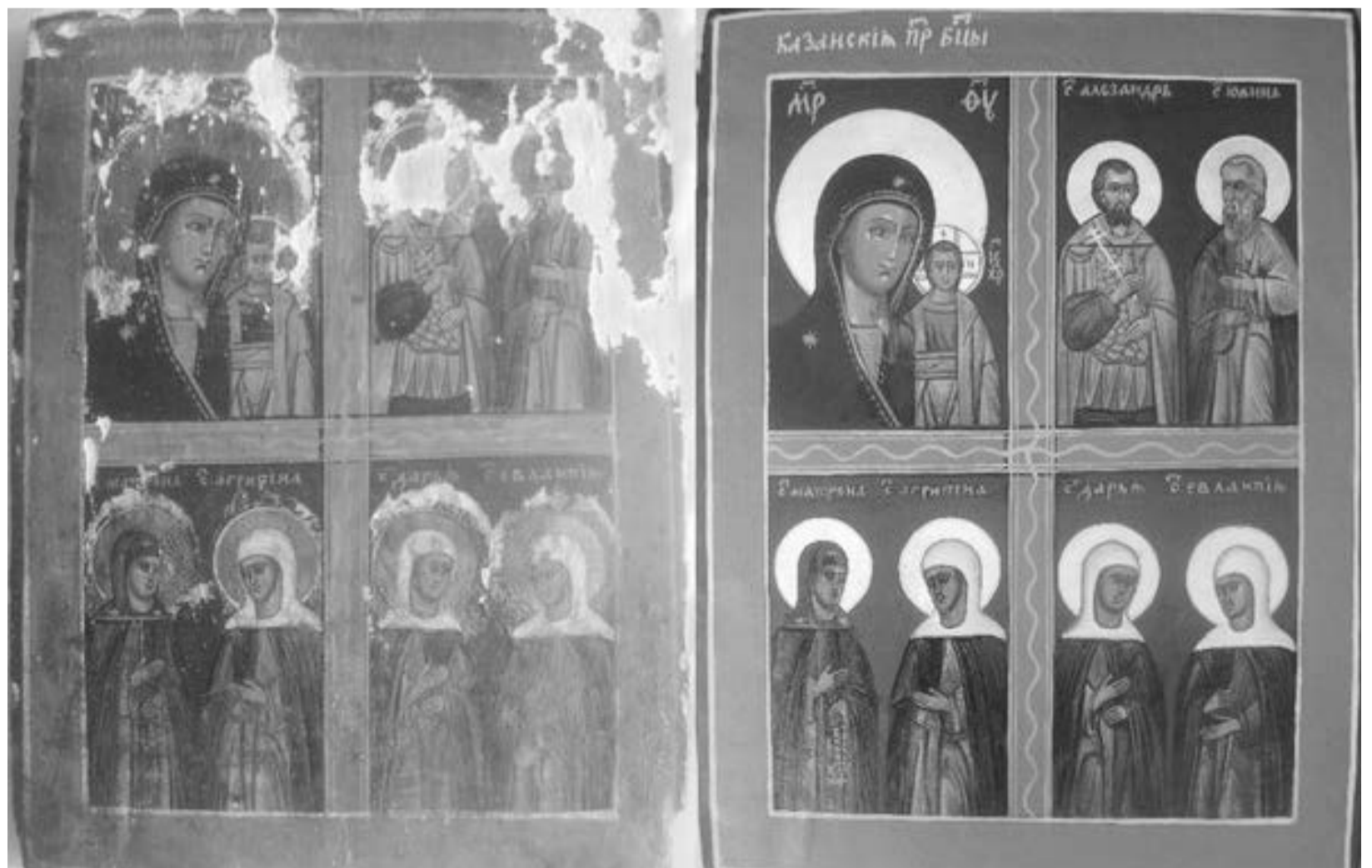
Икона, отреставрированная автором