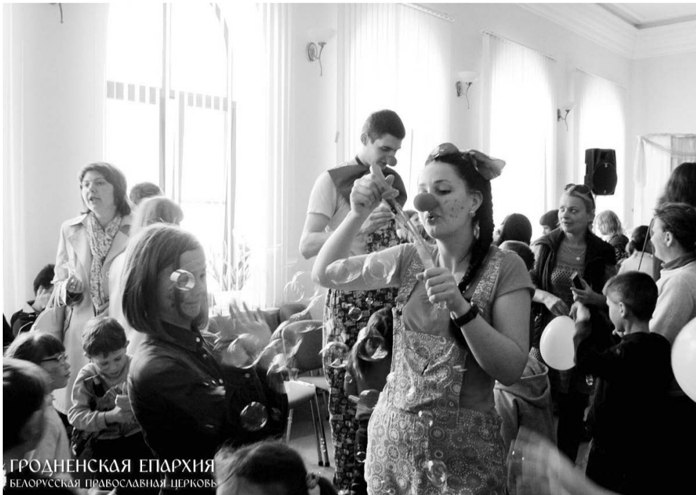
ГРОДНЕНСКАЯ ЕПАРХИЯ БЕЛОРУССКАЯ ПРАВОСЛАВНАЯ ЦЕРКОВЬ

26 апреля 2015 года под руководством Гродненского благотворительного общества и при помощи молодежи Свято-Владимирского молодежного братства прошел так всеми ожидаемый День Добра. В этом году праздник было решено провести в День Жен-мироносиц. Главной идеей и целью праздника было рассказать в лицах, историях что такое добро в жизни каждого, помочь человеку вспомнить, когда он был равнодушным или когда он оказался рядом с равнодушными людьми, родить желание тво-