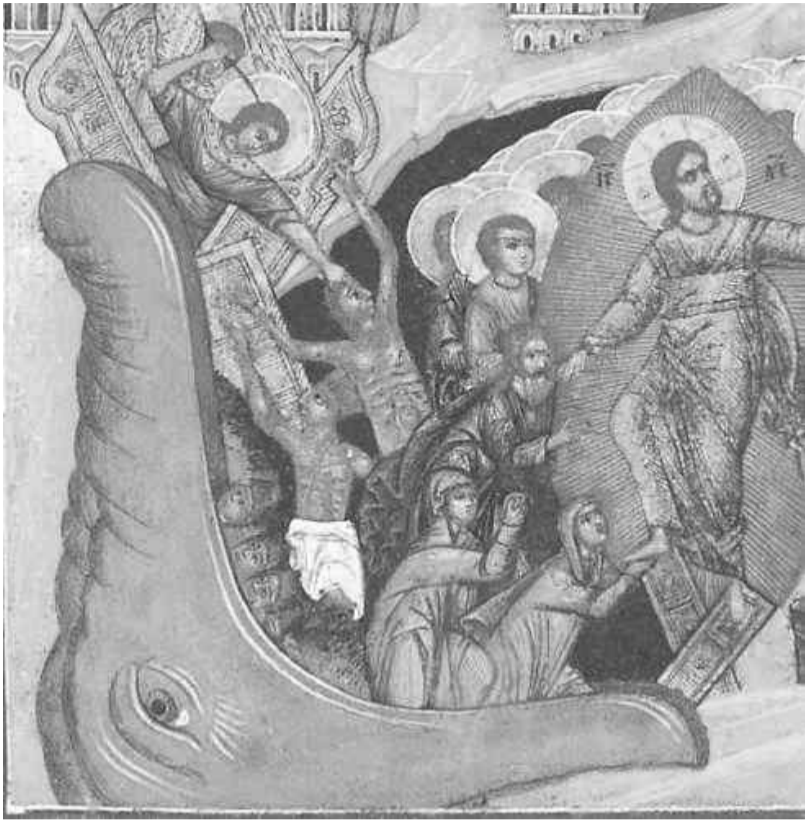
Сошествие во ад (фрагмент)

запрещения в VII в. символических изображений жизни Иисуса впервые стали появляться иконографические образы евангельских событий, в том числе и свидетельств Воскресшего Спасителя, но иконографии с идеей победы Иисуса над смертью и разрушением ада не было. Только в VIII в. в Византии появляется композиция «Сошествие во ад». В IX веке икона с этой композицией пришла в Древнюю Русь, получила название «Воскресение Христово» и стала самой популярной. Этот образ очень глубокий и богословски насыщенный. Он воплощает главную идею Пасхи - спасения человека от смерти. Разрушение ада, уничто-