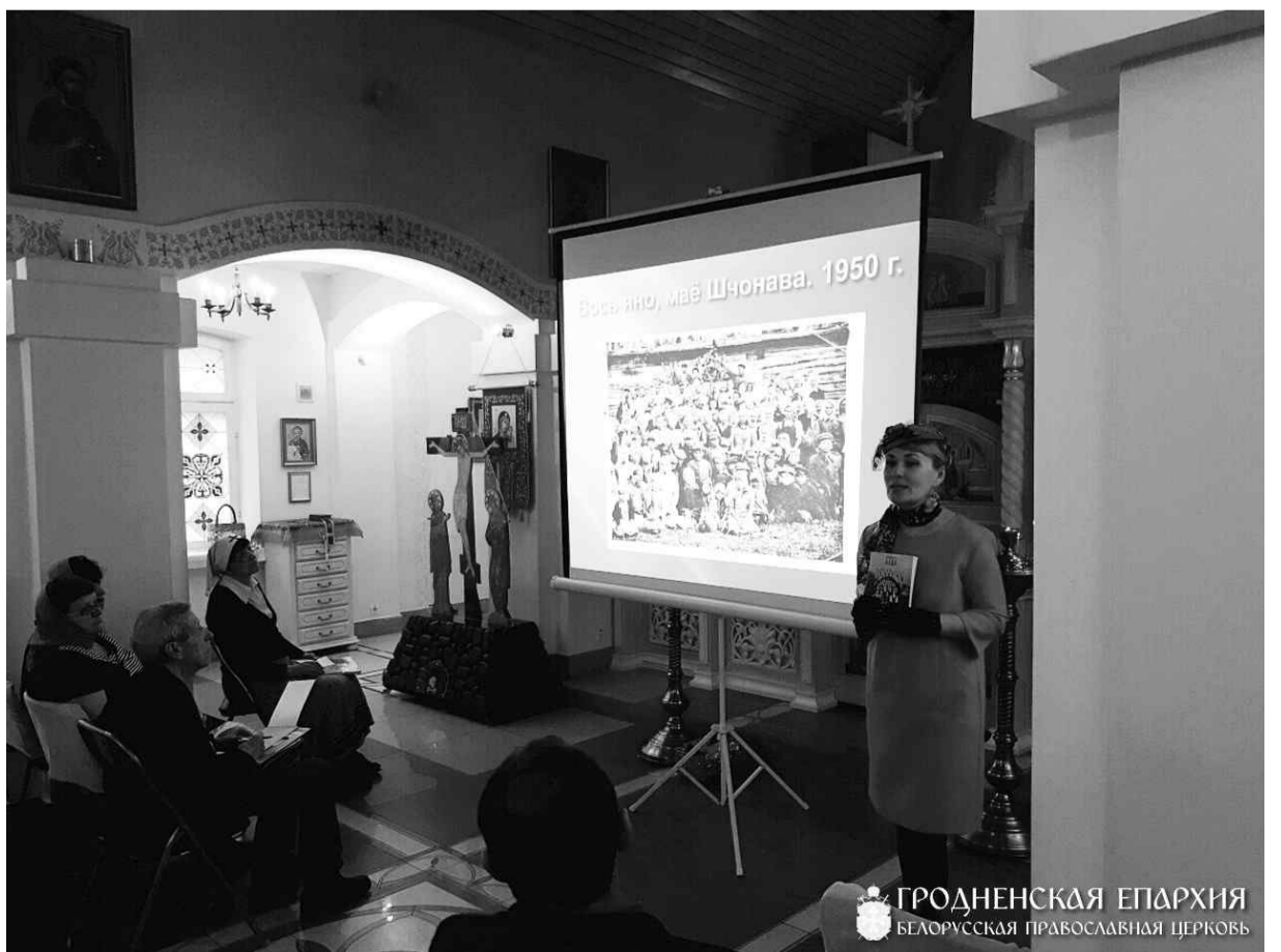
ГРОДНЕНСКАЯ ЕПАРХІЯ БЕЛАРУССКАЯ ПРАВОСЛАВНАЯ ЦЕРКВА

"абразкі" не назавеш чыста зборнікам краязнаўча-біяграфічных матэрыялаў. У гэтай прозе і лаканічная дасканаласць слова, і эмацыянальнасць, і пацудоўнасць, і аўтарскае стаўленне да сваіх землякоў – перадусім нейкая настальгічная любоў, на адлегласці часу ўзмоцненая. І думаецца: