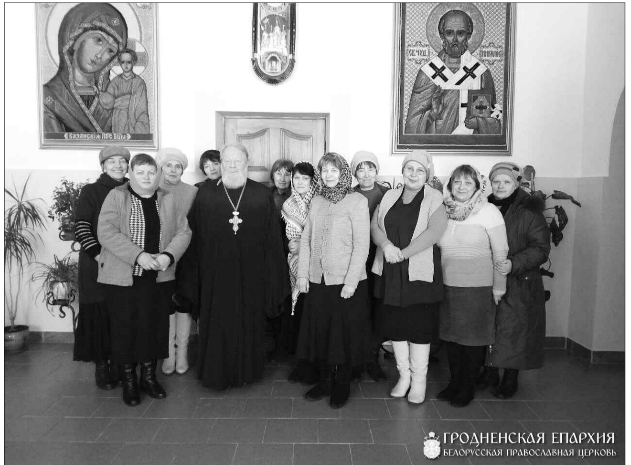
ГРОДНЕНСКАЯ ЕПАРХИЯ БЕЛОРУССКАЯ ПРАВОСЛАВНАЯ ЦЕРКОВЬ