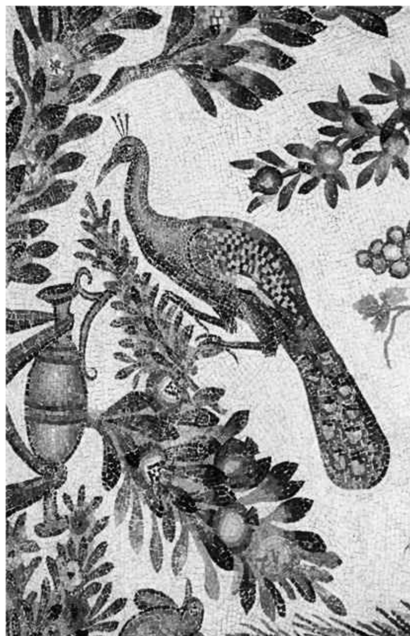
Павлин. Мозаика мавзолея Санта Канстанца, Рим. IV в

В Псалмах Давида содержится целый ряд пророчеств о схождение Господа в преисподнюю и изведении оттуда душ праведников: «Яко не оставиши душу мою во аде» (Пс. 15, 10); «Возьмите врата князи ваши, и возьмитесь врата вечная, и внидет Царь славы. Кто есть сей Царь славы? Господь крепок и силен» (Пс. 23, 7–8); «Господи, возвел еси от ада душу мою» (Пс. 29:4). Есть намек на избавление праведников от уз смерти Воскресшим Христом и у евангелиста: «Земля потряслась; и камни расселись и гробы отверзлись; и многие тела усопших святых воскресли» (Мф. 27, 51–52). Прямо говорит об этом избавлении апостол Петр: «Христос, чтобы привести нас к Богу, однажды пострадал за грехи наши, праведник за неправедных, быв умерщвлен по плоти, но ожив духом, которым Он и находящимся в темнице ду-