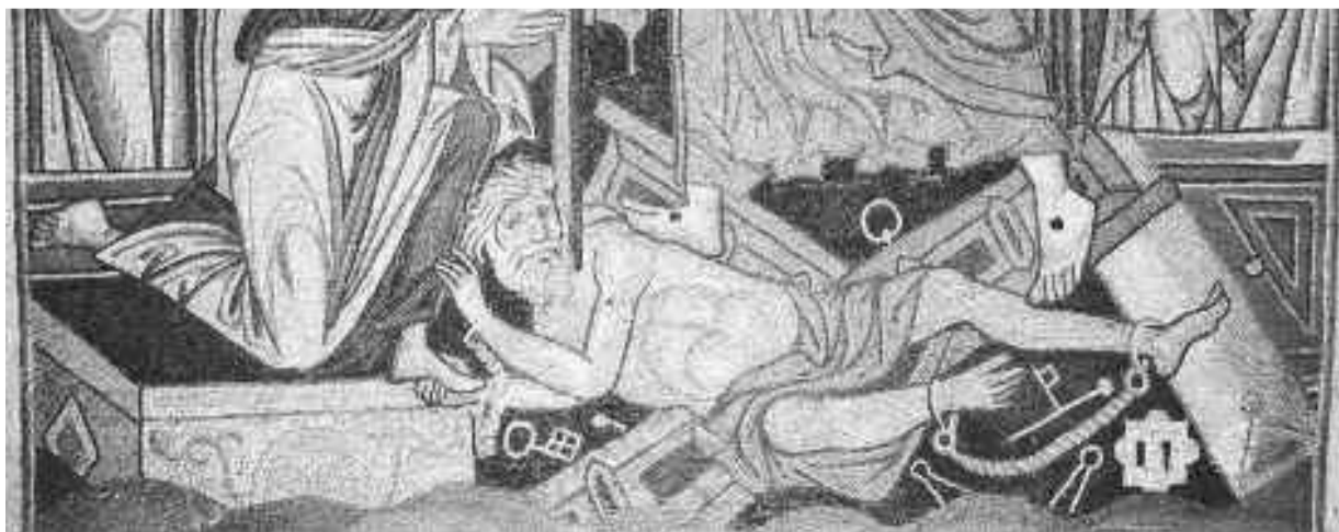
Сошествие во ад. (фрагмент). Мозаика монастыря Дафни, Афины. Начало XI в.

Однако, прежде чем появились иконы и фрески Воскресного цикла, древнехристианское искусство в силу принципиальной неизобразимости Воскресения, изображало его символически или аллегорически. Чаще всего использовалась история пребывания Ионы во чреве кита, о чем говорил сам Иисус, а также различные предметы, животные и растения, так или иначе связанные с Возрождением и Воскресением. Это были Ной, Иов, история трех отроков и Даниила во рву со львами, вознесение Илии-пророка, воскрешение Лазаря, а также образы дверей, птиц феникса, павлина, орла и даже цифровые обозначения, например, цифры восемь, символизирующей идею вечности и будущего века. После