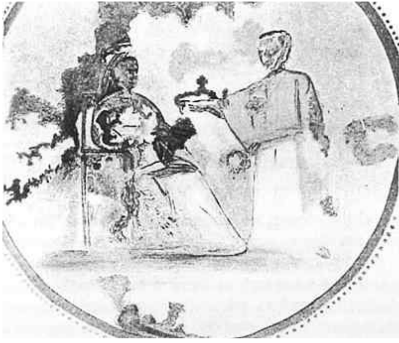
Росписи катакомб Присциллы. Середина III в. Рим

7 апреля Церковь празднует один из двенадцатых праздников - Благовещение Пресвятой Богородицы. Большинство из нас хорошо знает о событиях, которые вспоминаются в этот день и их значении - начале Воплощения Господа, и тем самым, начале нашего спасения. В этом номере "Гродненских епархиальных ведомостей" мы предлагаем нашим читателям познакомиться со способами иконографического изображения этого Богородичного праздника и их богатой символикой.