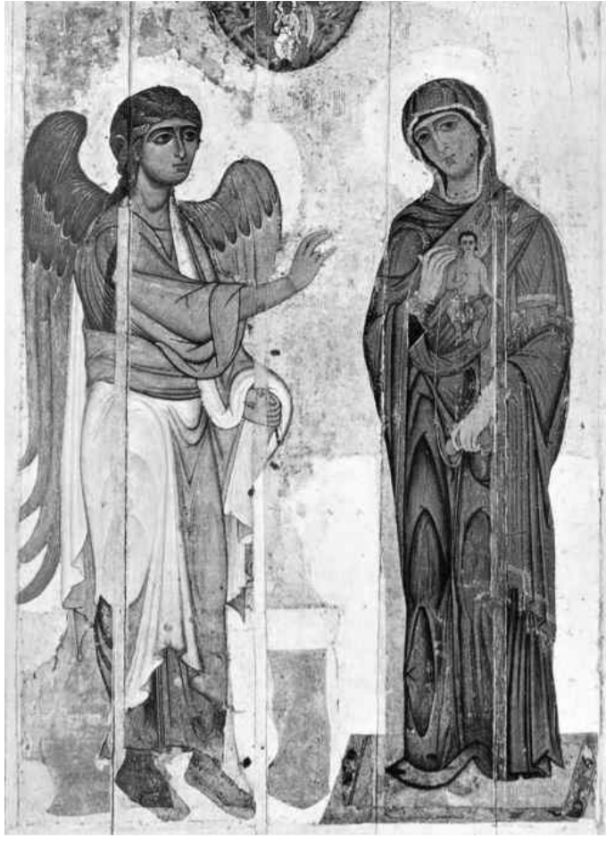
Икона из праздничного чина Успенского собора г.Владимира. 1408 г (II тип)