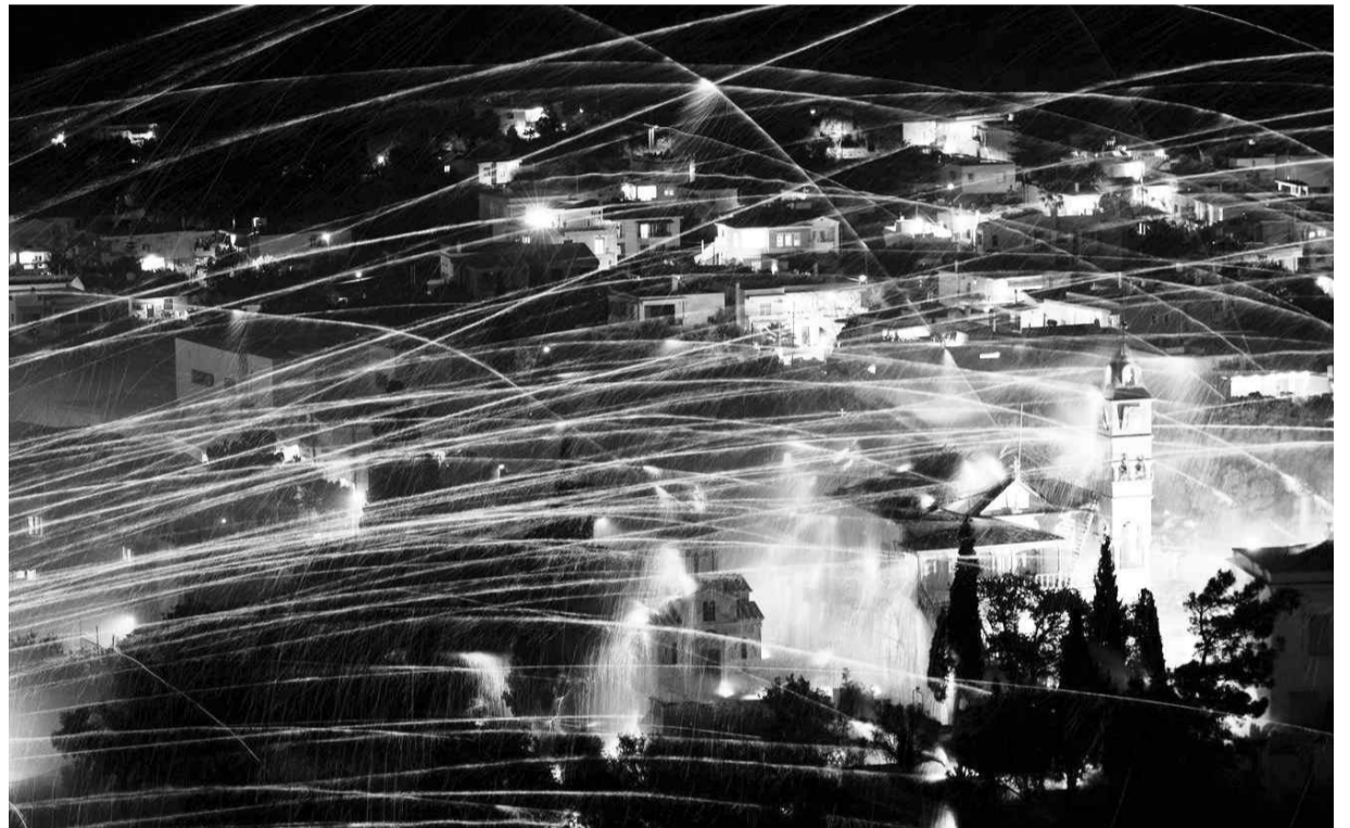
Пасхальные фейерверки на острове Хиос

В субботу все в ожидании схождения Благодатного огня. Его доставляют специальным рейсом из Иерусалима. А на пасхальной службе, после канона, выключается свет, открывается алтарь и из алтаря выходит епископ или священник и поет стихирю «Приидите, примите свет». И раздает огонь верующим. Потом пение епископа подхватывают священники, народ, хор.