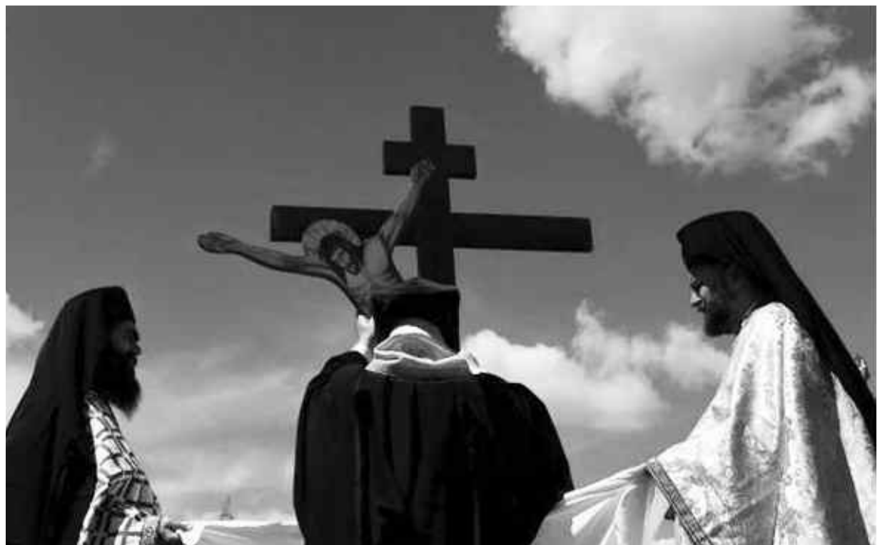
Священник снимает икону Христа со креста во время службы Великой Пятницы