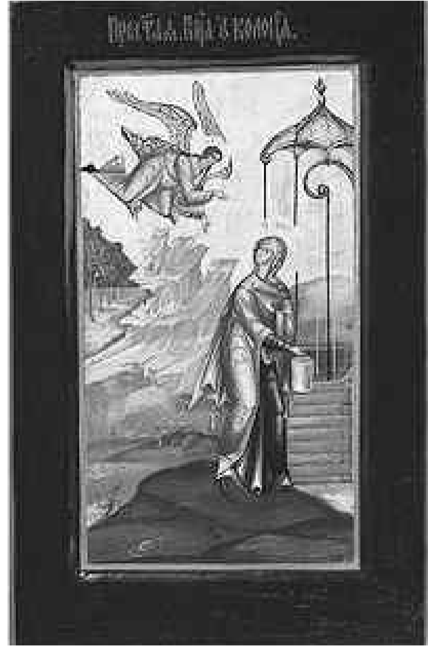
«Богородица у колодца». Середина XIX века, Мстёра (III тип)

её в тёмно-синем мафории (греч. – накидка), этот цвет означает бесконечность неба, является символом иного вечного мира, соединяет в себе земное и небесное, и синей же, но несколько более светлой,