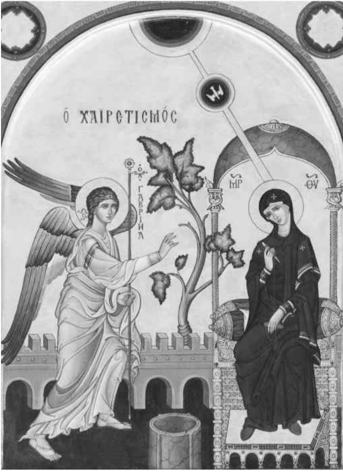
Современная икона праздника Благовещения. (I тип)