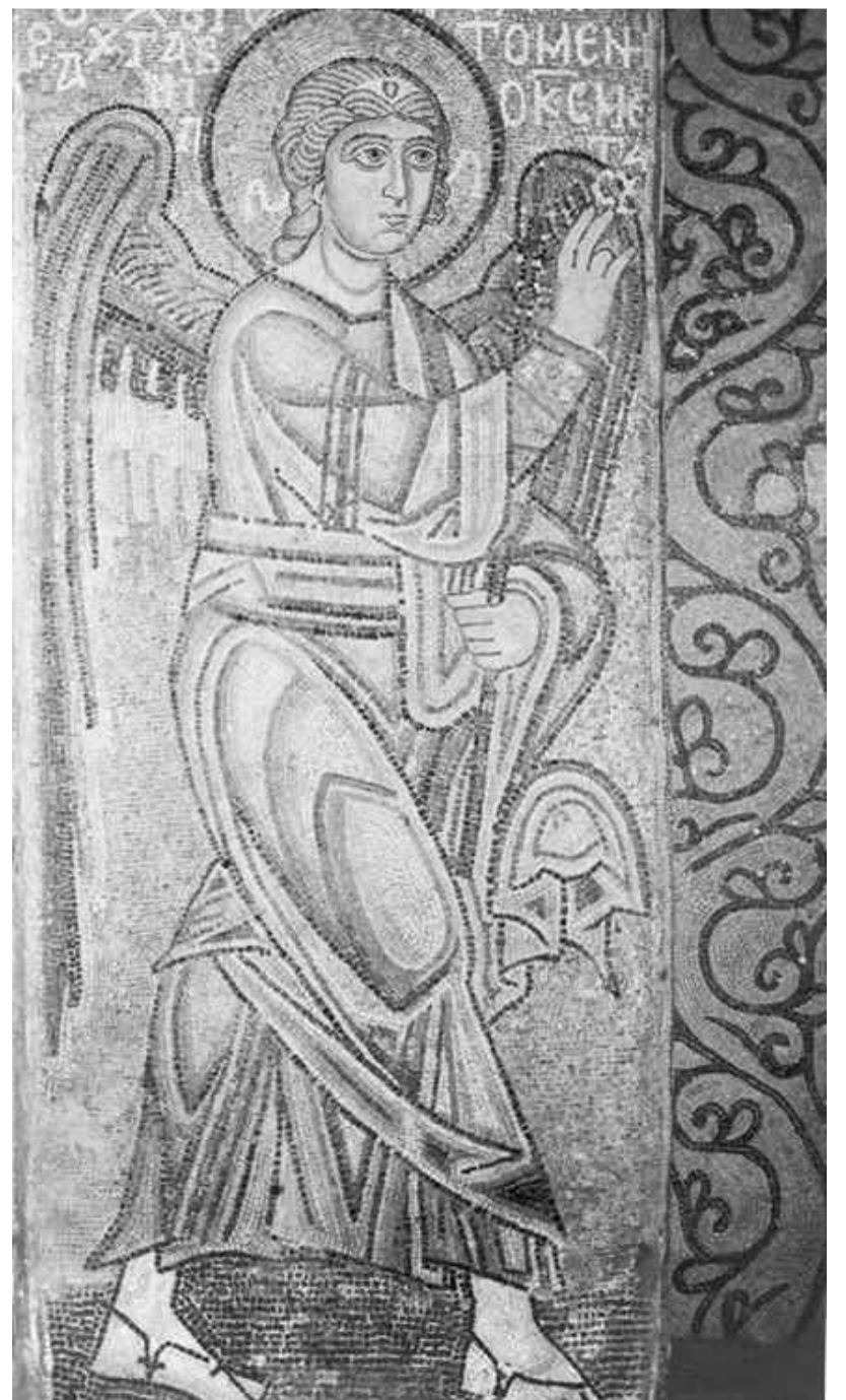
Мозаика Софии Киевской (XI век) "Благовещение". Архангел Гавриил. Столб предалтарной арки

На противоположном столбе смиренно предстает Непорочная Дева. Фигура Богородицы статична. Иконописец изобразил