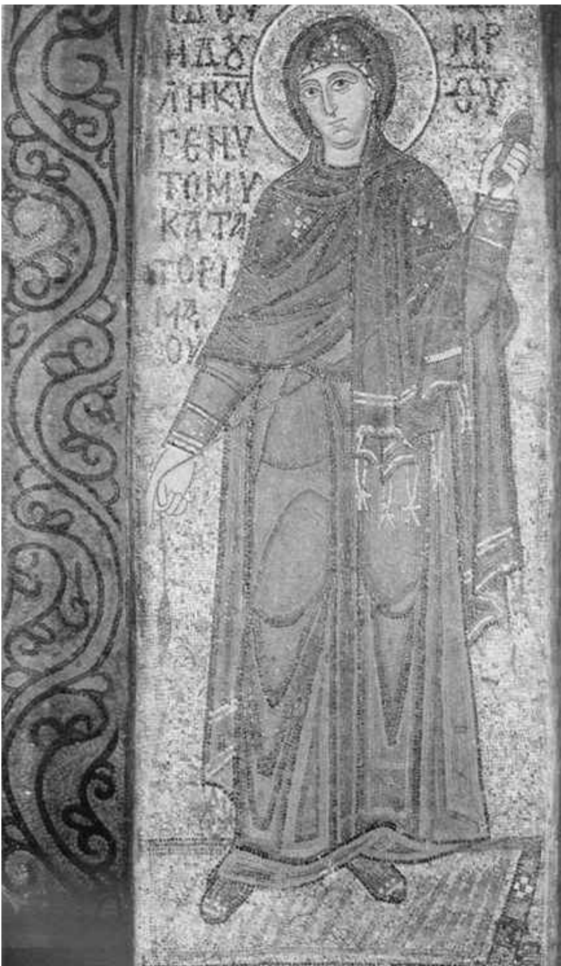
Мозаика Софии Киевской (XI век) "Благовещение". Дева Мария. Столб предалтарной арки