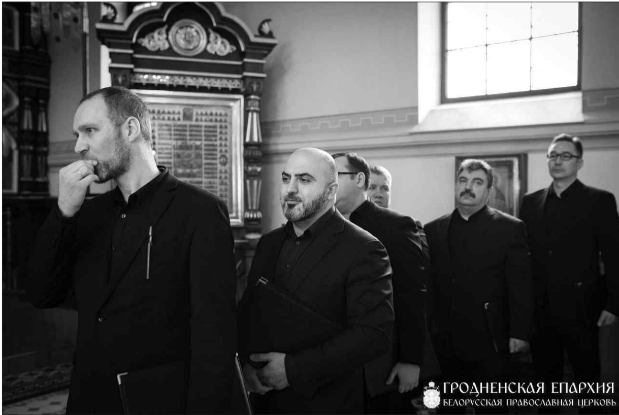
ГРОДНЕНСКАЯ ЕПАРХИЯ БЕЛОРУССКАЯ ПРАВОСЛАВНАЯ ЦЕРКОВЬ

публика. Перед фестивалем у нас были большие сложности, потому что буквально за неделю до репетиций заболели двое, они просто потеряли голос. Мы ехали без репетиций, у нас было 30 минут на то, чтобы собраться. И я вижу, что у нас где-то, возможно, недоработка. А тебе так хлопают – я это воспринимаю как большую радость. Я вообще каждый день воспринимаю как большой подарок от Бога. И это было со мной всегда.