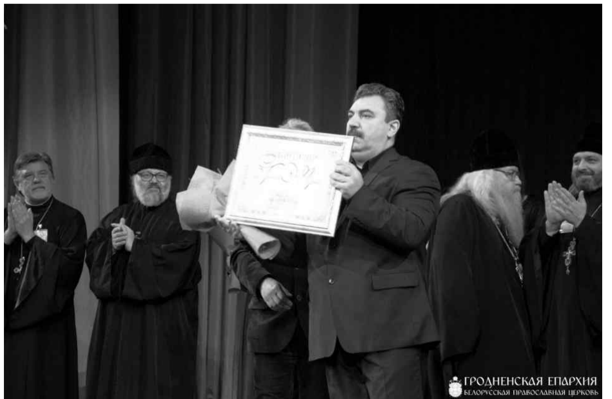
ГРОДНЕНСКАЯ ЕПАРХИЯ БЕЛОРУССКАЯ ПРАВОСЛАВНАЯ ЦЕРКОВЬ

Ансамбль «ДОРОС», выступивший более чем с 500 концертами в России и Европе, принимает участие и в благотворительных проектах, сотрудничает с ассоциацией «Club de Chance» (Грузия – Франция – Россия).