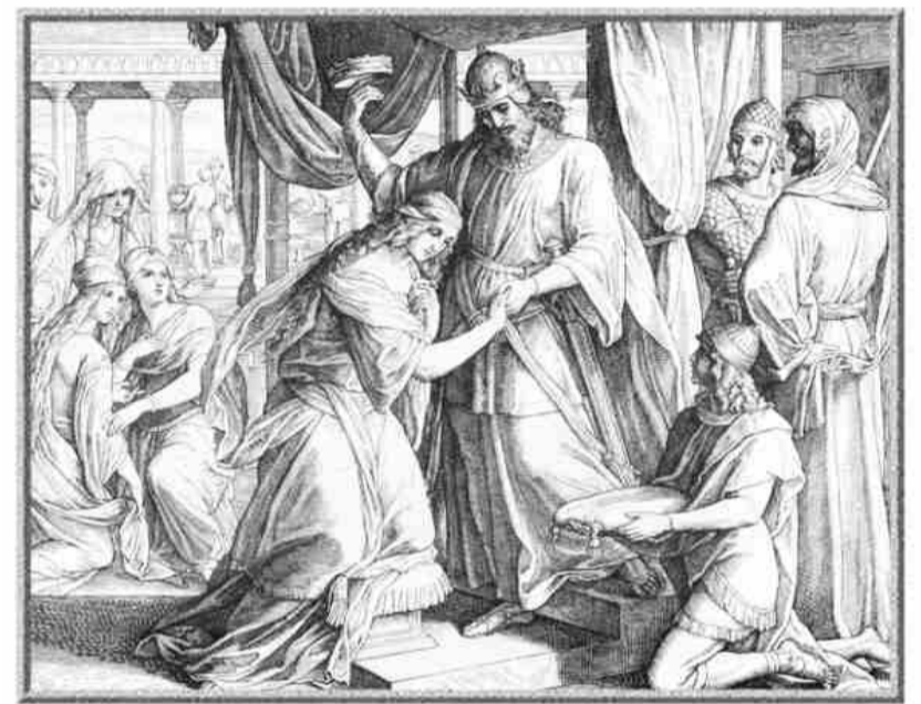
Юлиус Шнорр фон Карольсфельд. Эсфирь становится царицей. Гравюра.

в мире, решила действовать сама. Для начала она попросила всех евреев царского города Сузы объявить строгий трехдневный пост. Воздерживаясь от пищи, или, говоря библейским языком, «смирняя себя», люди пока-