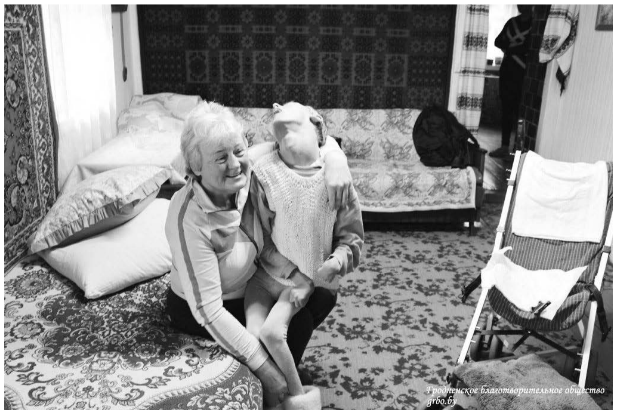
Гродненское благотворительное общество gтbo.by

«Гродненские епархиальные ведомости» издаются по благословению Высокопреосвященнейшего Артемия, Архиепископа Гродненского и Волковысского