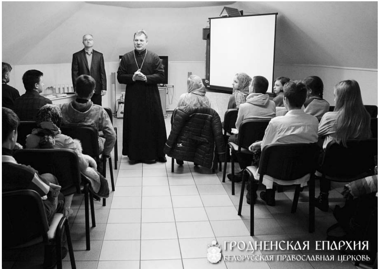
ГРОДНЕНСКАЯ ЕПАРХИЯ БЕЛОРУССКАЯ ПРАВОСЛАВНАЯ ЦЕРКОВЬ