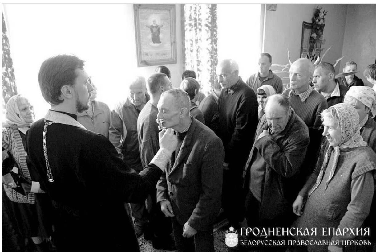
ГРОДНЕНСКАЯ ЕПАРХИЯ БЕЛОРУССКАЯ ПРАВОСЛАВНАЯ ЦЕРКОВЬ

Я возвращался домой и думал о людях, которые живут, а скорее выживают в этих стенах интерната. Им досталось столько страданий, и на данном этапе они