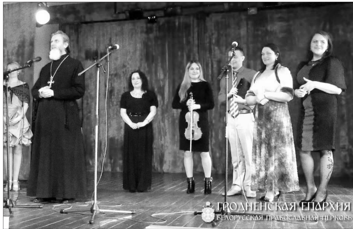
ГРОДНЕНСКАЯ ЕПАРХИЯ БЕЛОРУССКАЯ ПРАВОСЛАВНАЯ ЦЕРКОВЬ

преподобного Серафима Саровского, находящийся на территории колонии. Гости поставили свечи к иконам, прося у Всевышнего терпения и вразумления для осужденных, прощения их грехов и наставления на путь истинный. По просьбе заключенных в церкви еще раз была исполнена молитва Богородице.