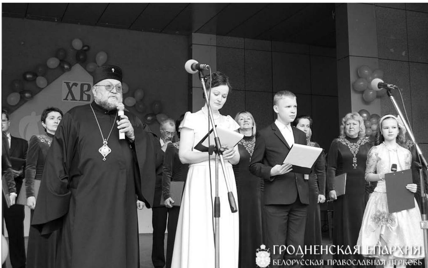
ГРОДНЕНСКАЯ ЕПАРХИЯ БЕЛОРУССКАЯ ПРАВОСЛАВНАЯ ЦЕРКОВЬ

11 мая 2014 года в парке имени Жилибера состоялся самый светлый и такой нужный праздник – День Добра. Необходимо отметить, что наш День Добра - не единственный добрый день в году, он лишь логическое завершение нашего доброго года и является итоговым и завершающим в благотворительном добром