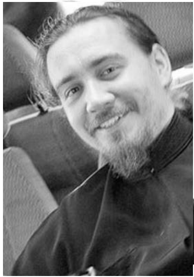
А вы помните свое первое Рождество?