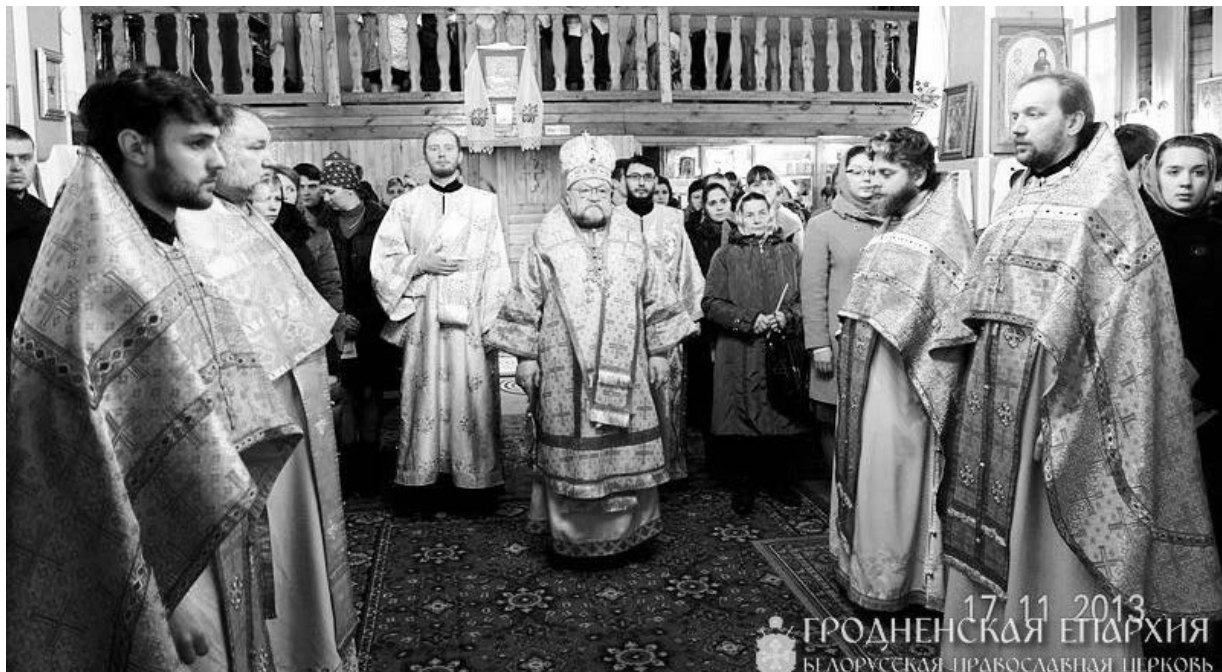
17.11.2013 ГРОДНЕНСКАЯ ЕПАРХИЯ БЕЛОРУССКАЯ ПРАВОСЛАВНАЯ ЦЕРКОВЬ

Секретариат Объединения Молодежи Белорусской Православной Церкви