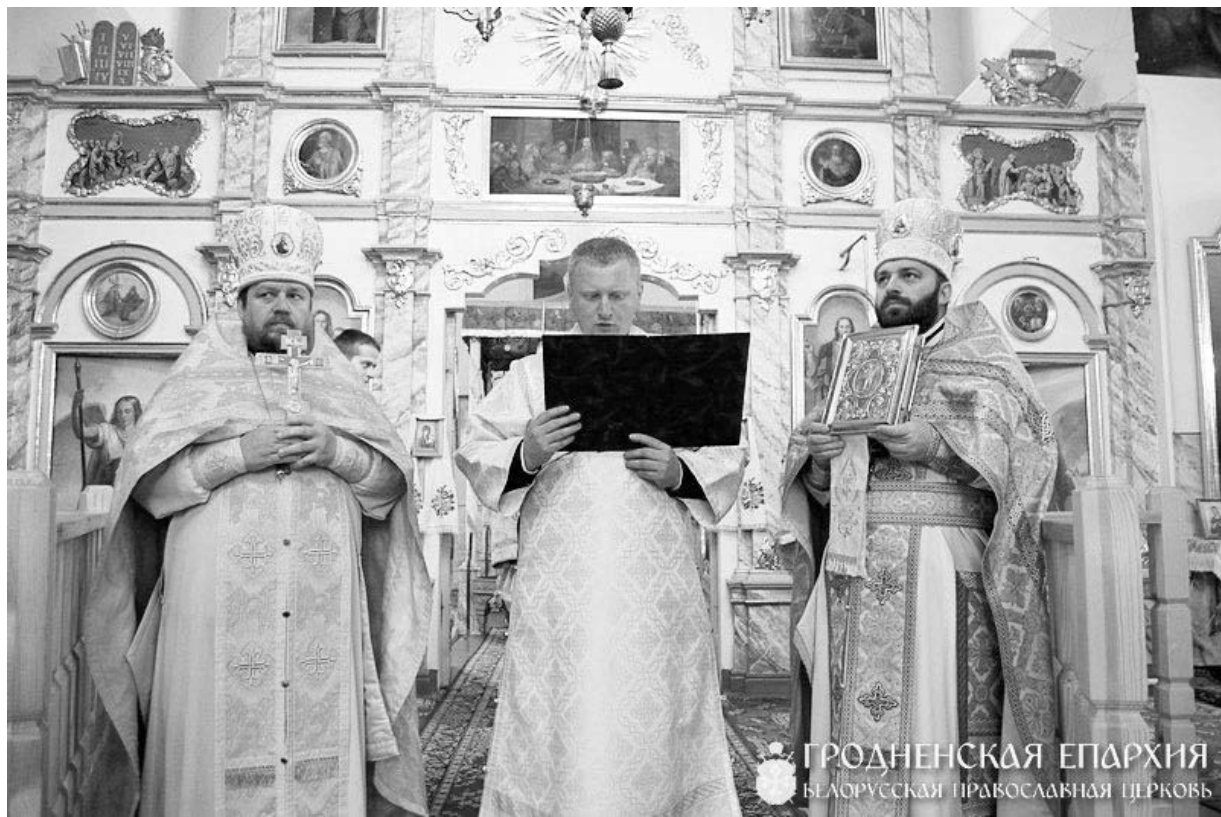
ГРОДНЕНСКАЯ ЕПАРХИЯ БЕЛОРУССКАЯ ПРАВОСЛАВНАЯ ЦЕРКОВЬ