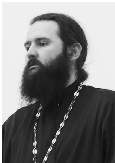
Что Ти принесу...

natalianet: Как-то были в Новоафонском монастыре в Абхазии, услышали как девушка делилась с мамой: "Здесь даже иконы Матронушки нет, это какая-то не наша вера..."