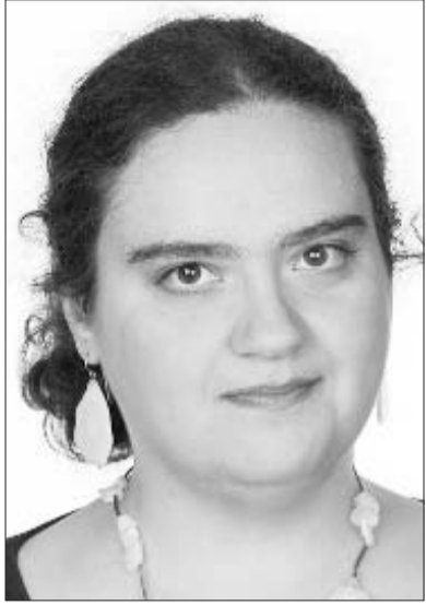
Как-то я спорила с кем-то умным о