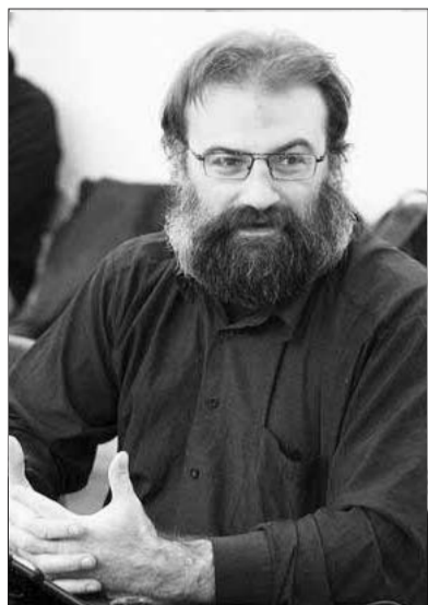
Цена жертвенного служения

Евангелие сегодня повествует о том, как Господь вошел в дом Петра и исцелил его тещу. И привели к нему многих больных и бесноватых. Он исцелил больных и изгнал духов.